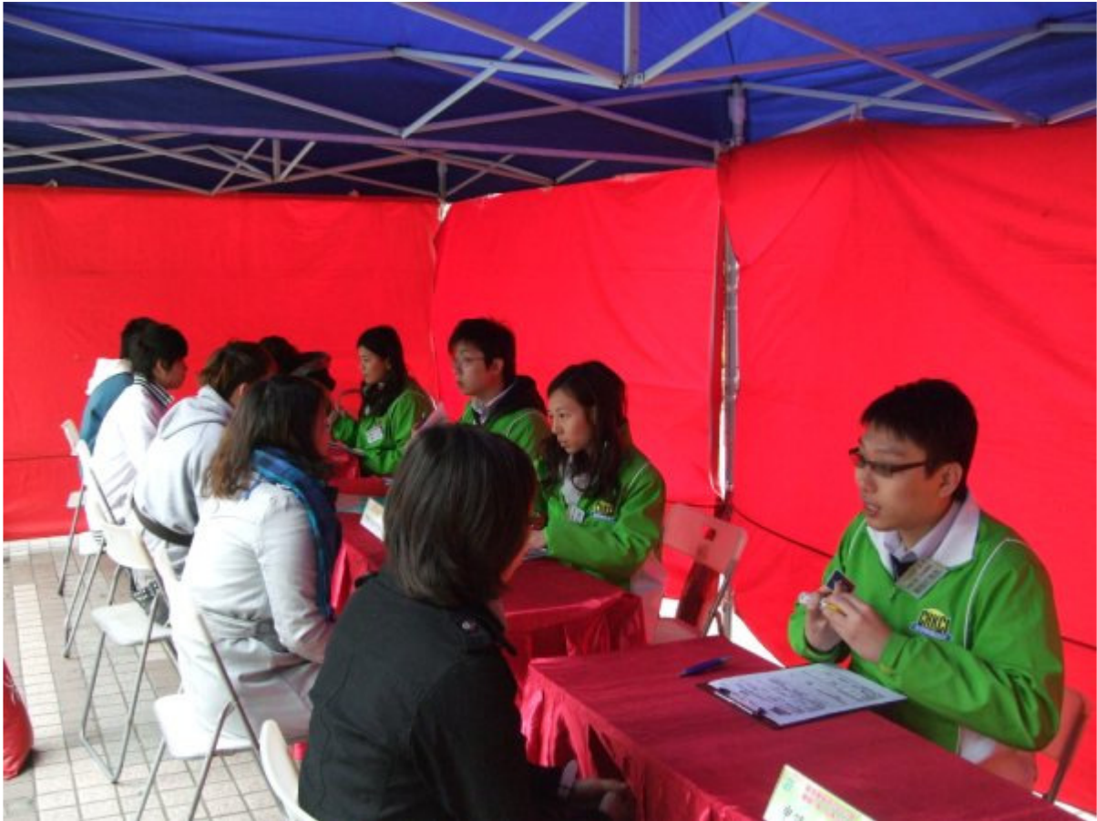
招聘會的面試情況。